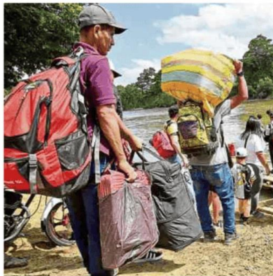
Los enfrentamientos Eln-disidencias de las Farc en el Catatumbo provocaron el desplazamiento de miles de personas.

criminales organizados. Lo cierto, en cualquiera de los dos casos, es que el error que se cometió ha sido muy costoso. Sea cual fuere su motivación, este enfoque generó confusión en las Fuerzas Armadas, incertidumbre entre la población civil y una oportunidad enorme para que los grupos armados ampliaran y fortalecieran su control en los territorios, dejando a la población civil desprotegida. En muchas regiones, las Fuerzas Armadas no sabían con claridad dónde debían suspender sus operaciones y dónde continuar, mientras que las comunidades locales recibieron poca información sobre sus dere-