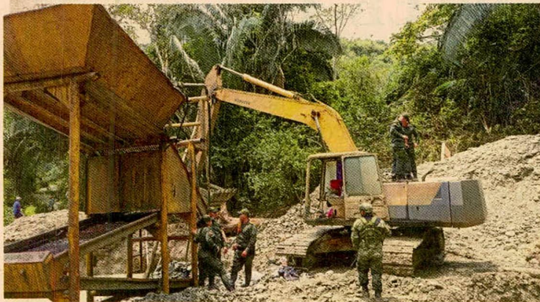
Entre enero y julio de este año se intervinieron 3.923 minas ilegales en el país.

estructuras criminales hacia delitos que afectan de manera directa la libertad individual y el clima de inversión en varias regiones. El tráfico de migrantes, por su parte, se desplomó de 17 casos a apenas uno, aunque expertos advierten que puede tratarse de un cambio en las rutas o de un subregistro.